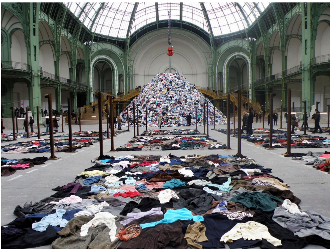
כריסטיאן בולטנסקי (1944-2021), מישהו/אף אחד , מיצב במוזיאון גרנד פלה בפריז, 2010, 50 טונות של בגדים, מנוף, רמקולים.

חֶזֶק וְנִתְחַזַּק בְּעַד-עַמָּנוּ וּבְעַד עַרְי אֶלְהִינוּ וְה' יַעֲשֶׂה הַטּוֹב בְּעֵינֵינוּ